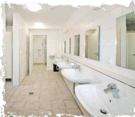
↻ Gleich neben den Zelten: Großzügige sanitäre Anlagen mit barrierefreiem Zugang.