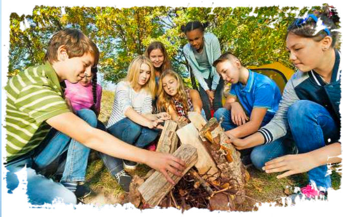
☞ Nicht nur nützlich beim Kochen im Freien: Mit Feuerkunde und Feuerparcours den sicheren Umgang mit Feuer erlernen.