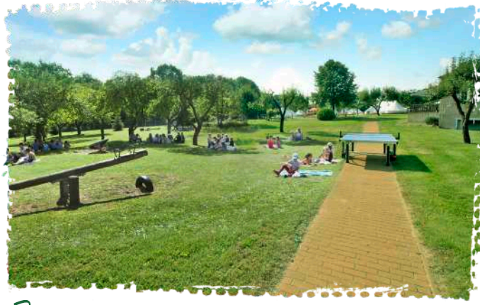
☞ Liegewiesen und Sitzcken, Spielgeräte und Tischtennis: Das weitläufige Campgelände bietet viel Raum für Bewegung und Freizeit.