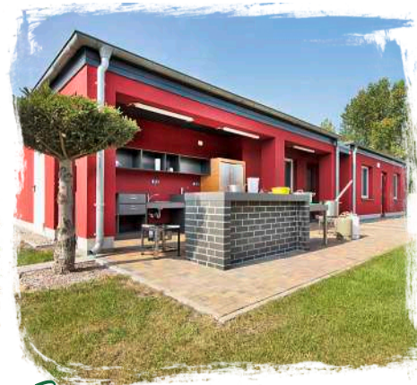
↻ Die bestens ausgestattete Outdoorküche macht für alle das Kochen zum Vergnügen.