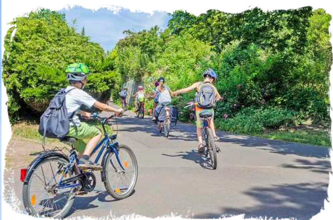
☞ Idealer Ausgangspunkt für Radtouren: Falkenhagen liegt auf der Strecke vieler bestens ausgebauter Radrundwege.