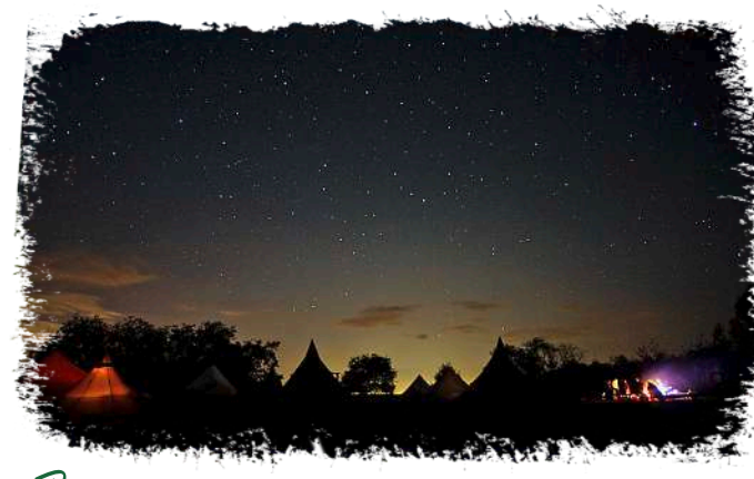
☞ Bei Lagerfeuer und Nachtwanderung: Ein prachtvoller Sternenhimmel, wie er in der Stadt nicht mehr zu sehen ist.