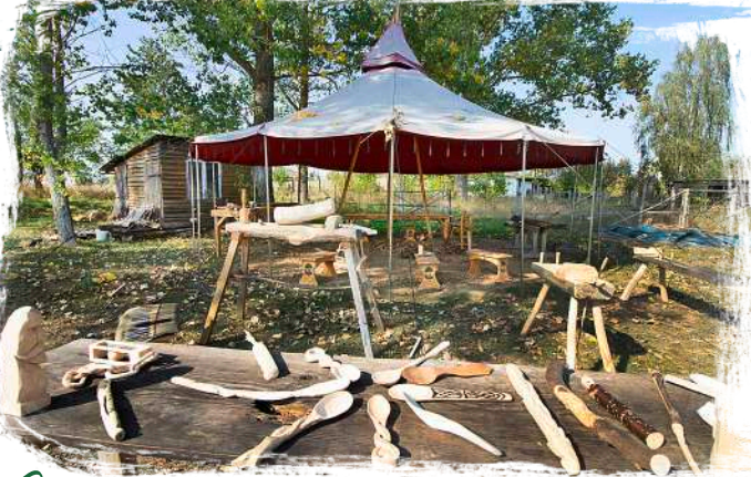
☞ Draußen oder in unserer Holzwerkstatt: Vom Löffelschnitzen bis Bush-Crafting lernen Kinder handwerkliches Arbeiten.