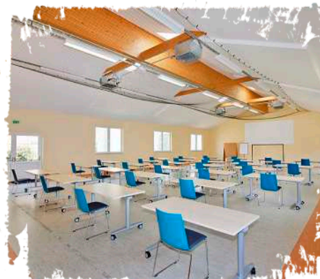
↻ Mit 240 qm viel Platz für Spiel, Sport, Tanz und Seminarveranstaltungen: Die Mehrzweckhalle.