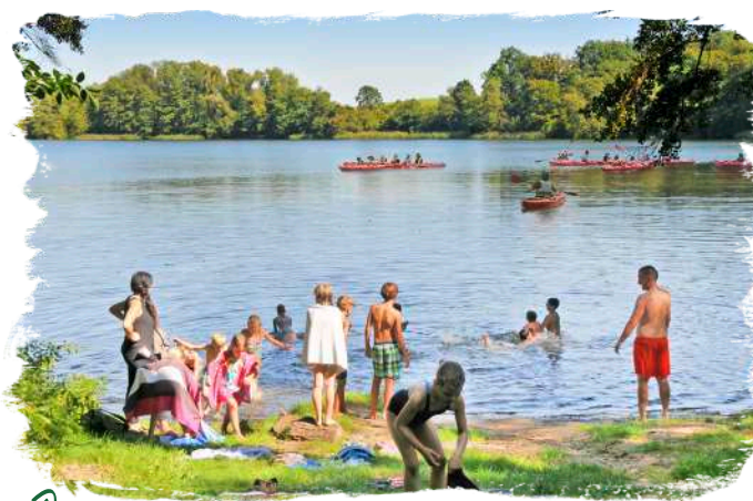
☞ Rund um das Oderlandcamp laden viele Seen zum Baden oder zu Paddeltouren mit Kajaks aus dem campeigenen Verleih.