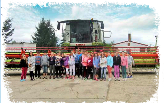
☞ Beim Besuch einer Agrarproduktion oder einer Imkerei sehen Kinder oft zum ersten Mal, wo das Essen herkommt.