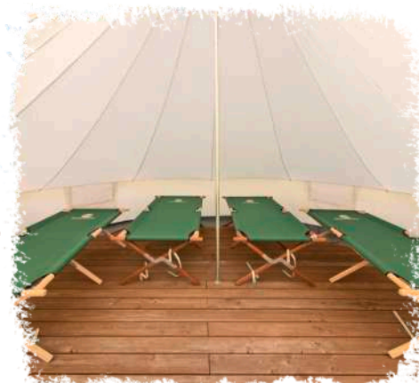
↻ Alle Zelte stehen auf trockenen Podesten und sind bei Bedarf mit Feldbetten ausgestattet.