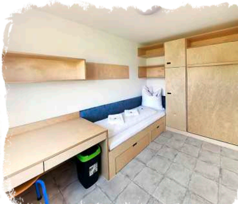
↻ Auf Wunsch stehen für unsere Gäste gleich neben dem Zeltplatz 1-/2-Bettzimmer bereit.