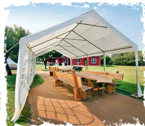
↻ Die gemeinsamen Mahlzeiten sind regelmäßig Höhepunkte des Tages.