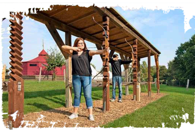
☞ Fördert Achtsamkeit, stärkt Ruhe und Konzentration: Die Bogenschießanlage ist ein Highlight des Oderlandcamps.