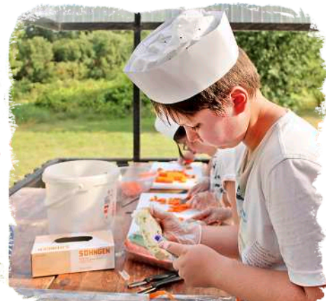
↻ Die Mahlzeiten werden von den Kindern und Jugendlichen selbst vorbereitet.