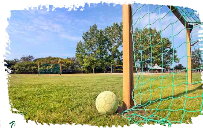
☞ Ideal für Ballspiele und Turniere: Ein Rasenfußballplatz und ein Beach-Volleyball-Feld befinden sich direkt auf dem Campgelände.