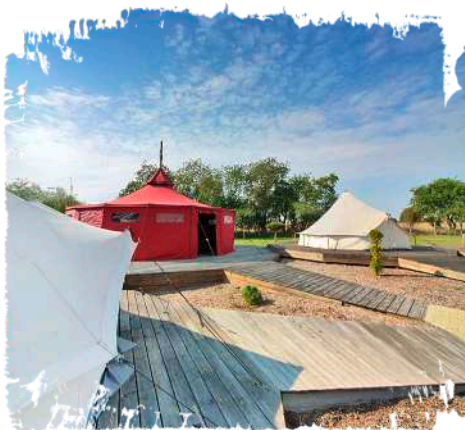
↻ Kinder und Jugendliche schlafen gern in den 12 geräumigen, modernen Zelten.